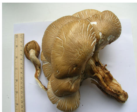
Рис. 3. Hypsizygus ulmarius

За господарським значенням основну частину виявлених видів грибів становлять неїстівні (17 видів). Частка інших груп макроміцетів була значно меншою: їстівні (9 видів) і умовно їстівний – 1.