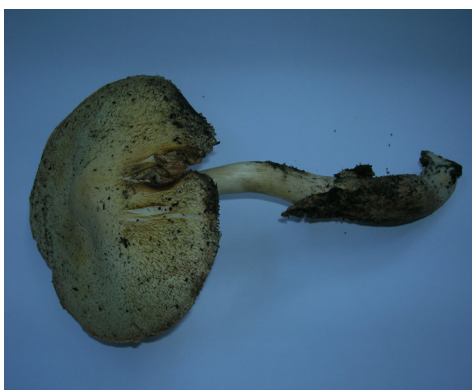
Рис. 2. Volvariella bombycina

рах слив і абрикоси звичайної можна бачити Phellinus igniarius , який викликає буру гниль деревини і поступову загибель цих порід. Fomes fomentarius широко поширений в місті ксилотроф, який вражає, перш за все, різні види кленів, кінський каштан звичайний, інколи – платан східний. Цей гриб викликає білу або мармурову гниль. Його плодові тіла в значній кількості утворюються на всихаючих і мертвих деревах. Восени після дощів на старих деревах клена ясенolistого, шовковиці білої можна бачити великі вухоподібні плодові тіла Polyporus squamosus , що викликає змішану гниль деревини. Серед ксилотрофів біля основи стовбурів таких порід як платан східний, тополя пірамідальна дуже поширеним був Coprinellus micaceus . Цікавими виявилися нові знахідки таких рідкісних видів як Volvariella bombycina (рис. 2) та Hypsizygus ulmarius (рис. 3).