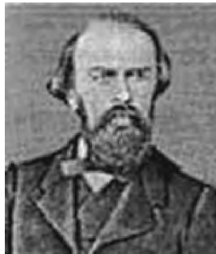
Л. С. Ценковський (1822—1887)

Першим завідувачем кафедри був Л. С. Ценковський (1822—1887), який не лише мав яскраву особистість і міг бути взірцем того, як цілком віддаючи себе науці, можна залишатися уважною цікавою людиною [2]. Він був засновником і першим президентом Новоросійського товариства природознавців, почесним членом майже усіх російських природничо-історичних товариств, Лондонського мікробіологічного товариства, членом-кореспондентом Петербурзької Академії наук, Німецького ботанічного товариства. Його ідеї та наукові надбання лягли в основу створення і розвитку кафедр ботаніки, гідробіології, мікробіології уні-