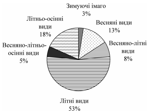
Рис. 2. Співвідношення основних груп бабок південного заходу України, що виділені за періодами льоту

1 — види, які зимують на стадії імаго; 2 — ранньовесняні види, представники яких появляються в травні і літають тільки весною, або такі, основна частина періоду льоту яких приходить на весну і закінчується на початку літа, не досягши його середини; 3 — весняно-літні види, у яких приблизно половина періоду льоту приходить на весну, а половина — на літо; 4 — літні види, які появляються наприкінці весни чи на початку літа і літають усе літо; 5 — весняно-літньо-осінні види з довгим періодом льоту — появляються у травні, але ще зустрічаються в жовтні; 6 — літньо-осінні види, які літають влітку та восени. Деякі можуть появлятися наприкінці травня.