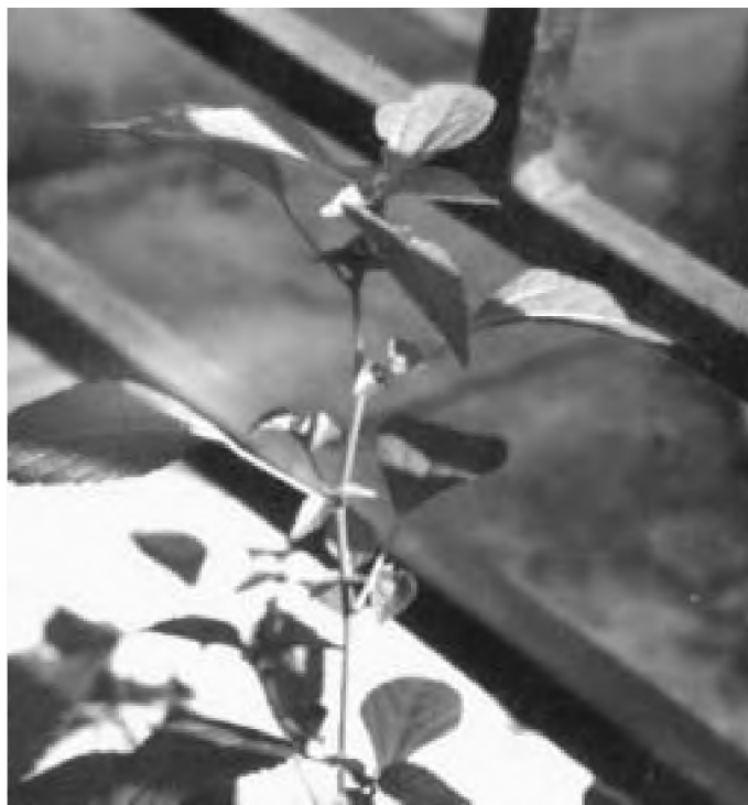
Рис. 1. Акаліфа південна. Загальний вигляд рослини

на одній особині складає 9–32. Найчастіше вони розташовані у пазухах листків. Тичинкові суцвіття видовжені, тонкі, довжиною до 2 см, ясно червоного кольору. Дуже опушені плоди — регми мають три, іноді чотири насінини. Кількість насінин з однієї особини — до 100. Лабораторні дослідження схожості свіжезібраного насіння виявились негативними.