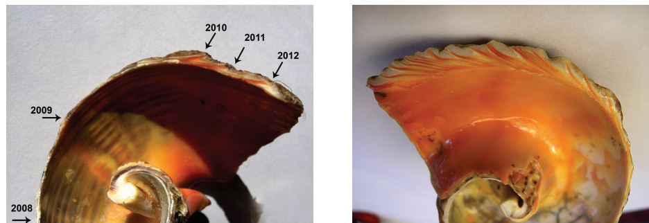
Рис. 1. Годовые нерестовые метки на поперечном спице раковины Rapana venosa из Одесского залива (1) и о. Змеиный (2)

приостанавливают рост раковины и формируют годовую нерестовую метку одновременно с наращиванием толщины края (рис. 1, 1). В некоторых случаях, когда на спице видны множественные нерестовые метки (рис. 1, 2), возраст моллюска считали таким, как у одноразмерных особей с той же акватории моря. Ювенильные особи, количество которых в сборах незначительно, анализировались отдельно.